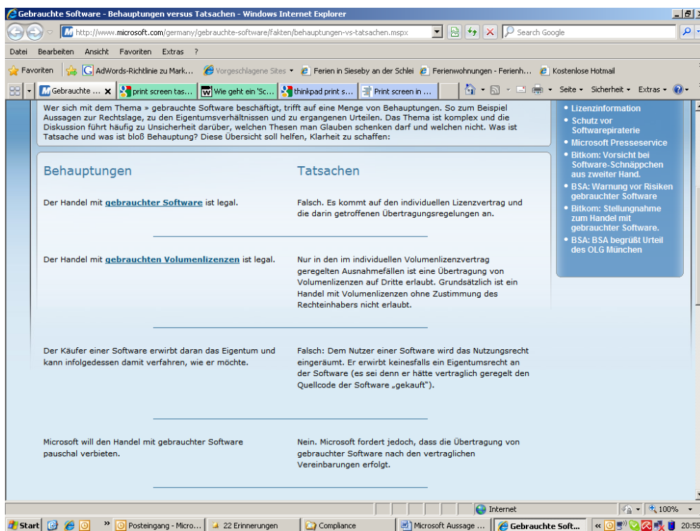
Screen-Shot Microsoft Deutschland Home Page / gebrauchte Software vom 23.03.2011 unter http://www.microsoft.com/germany/gebrauchte-software/fakten/behauptungen-vs-tatsachen.aspx